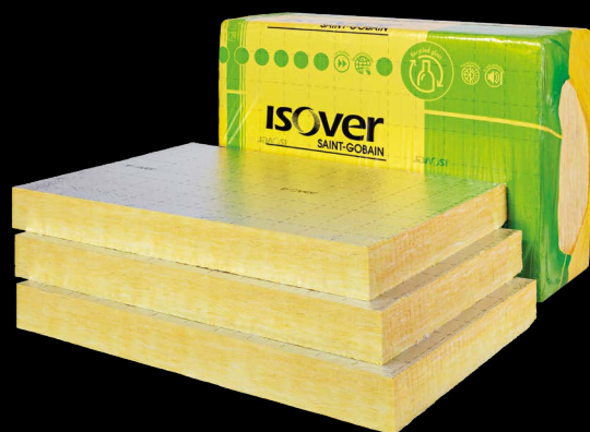
Multimax 31 Ultra

WILT U EEN MONSTER ONTVANGEN VAN MULTIMAX 31 ULTRA? GA DAN NAAR ISOVER.NL/MULTIMAX31ULTRA