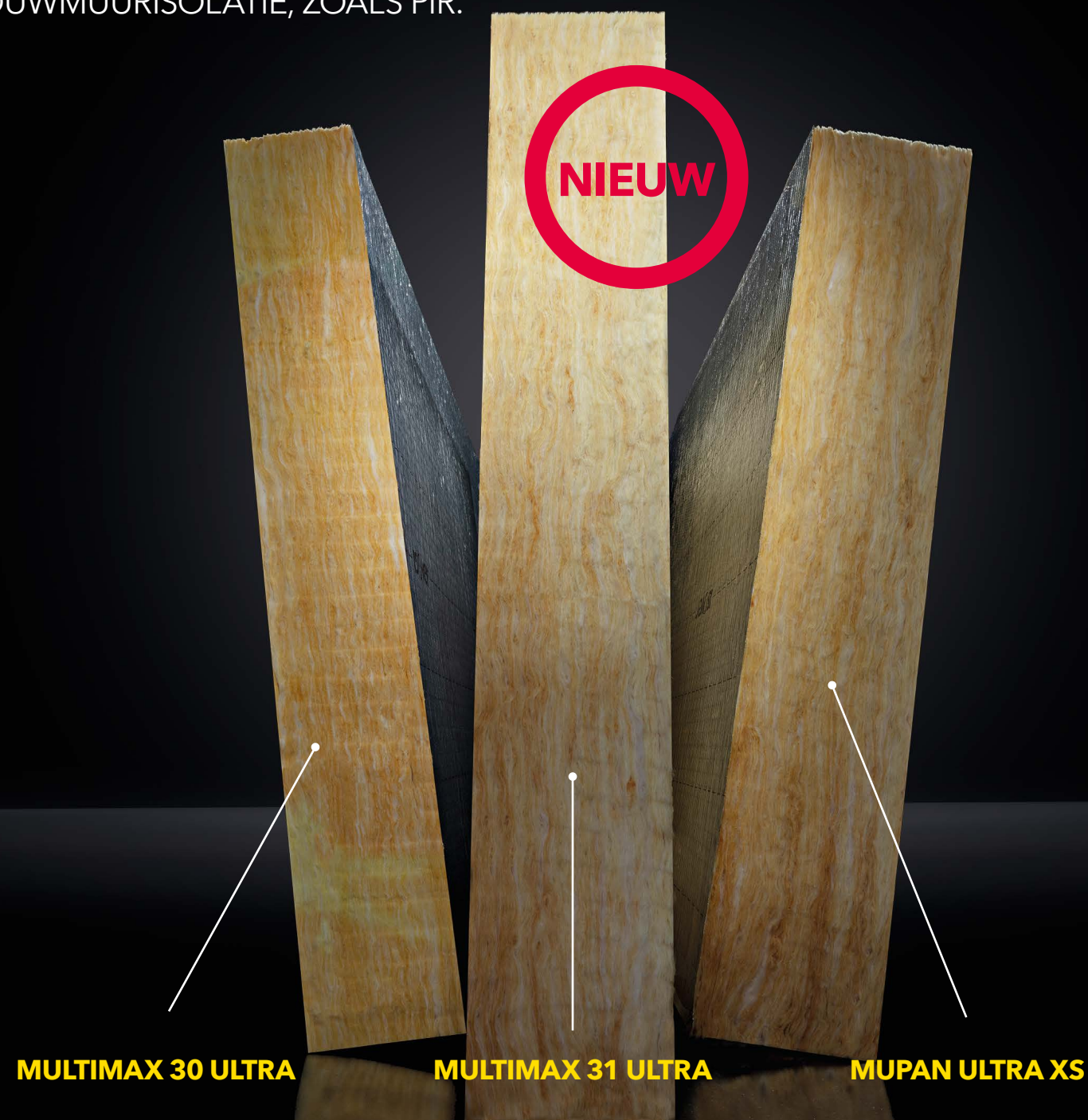
MULTIMAX 30 ULTRA

HET VOORDELIGE ALTERNATIEF VOOR HARDE SPOUWMUURISOLATIE, ZOALS PIR.